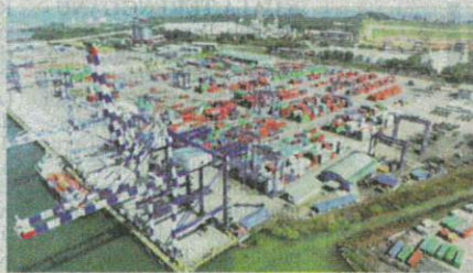
Kapal tangki minyak yang berdaftar di Pelabuhan Klang itu mempunyai sejarah pelayaran ke Pelabuhan Toyama Shinko, Jepun sebelum berlabuh di Pelabuhan Bintulu.

Satu kluster baharu iaitu Kluster Alam telah diisytiharkan di Sarawak setelah empat daripada kru kapal yang berlabuh di Pelabuhan Bintulu disahkan positif koronavirus (Covid-19).