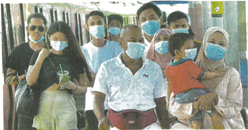
Pematuhan SOP dengan memakai pelitup muka khusus di kawasan tumpuan umum dan dalam pengangkutan awam dapat membendung penularan pandemik COVID-19.

gal bersama di Kementerian Kesihatan (KKM), bekerja sebagai satu pasukan dan juga bekerjasama dengan kementerian lain.