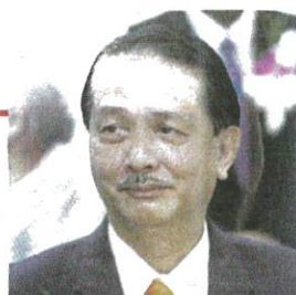
Tan Sri Dr Noor Hisham Abdullah