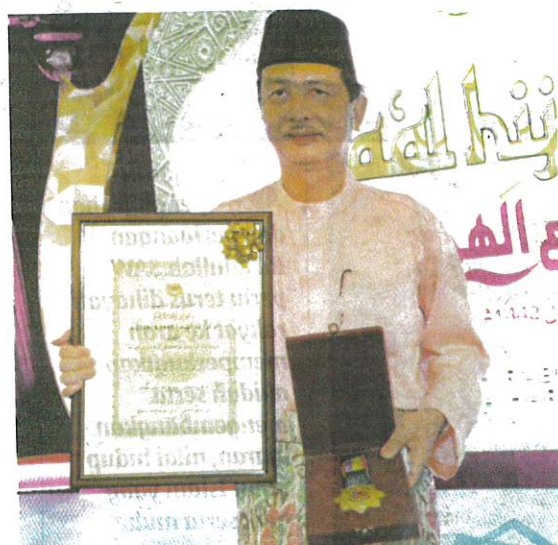
Dr Noor Hisham bersama sijil dan pingat Anugerah Tokoh Ma'al Hijrah pada Majlis Sambutan Ma'al Hijrah Peringkat Kebangsaan Tahun 1442H/2020M di Masjid Negara, Kuala Lumpur, malam kelmarin.